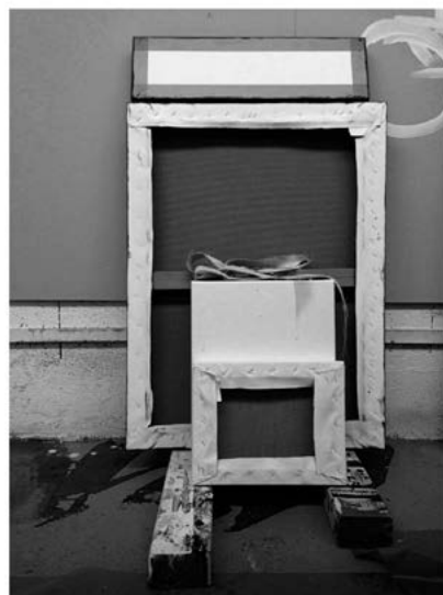
Je rêve de toi même la nuit